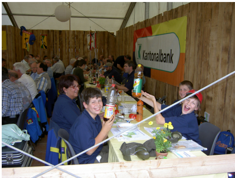
Jung und Alt beim gemeinsamen Mittagessen in Frauenfeld