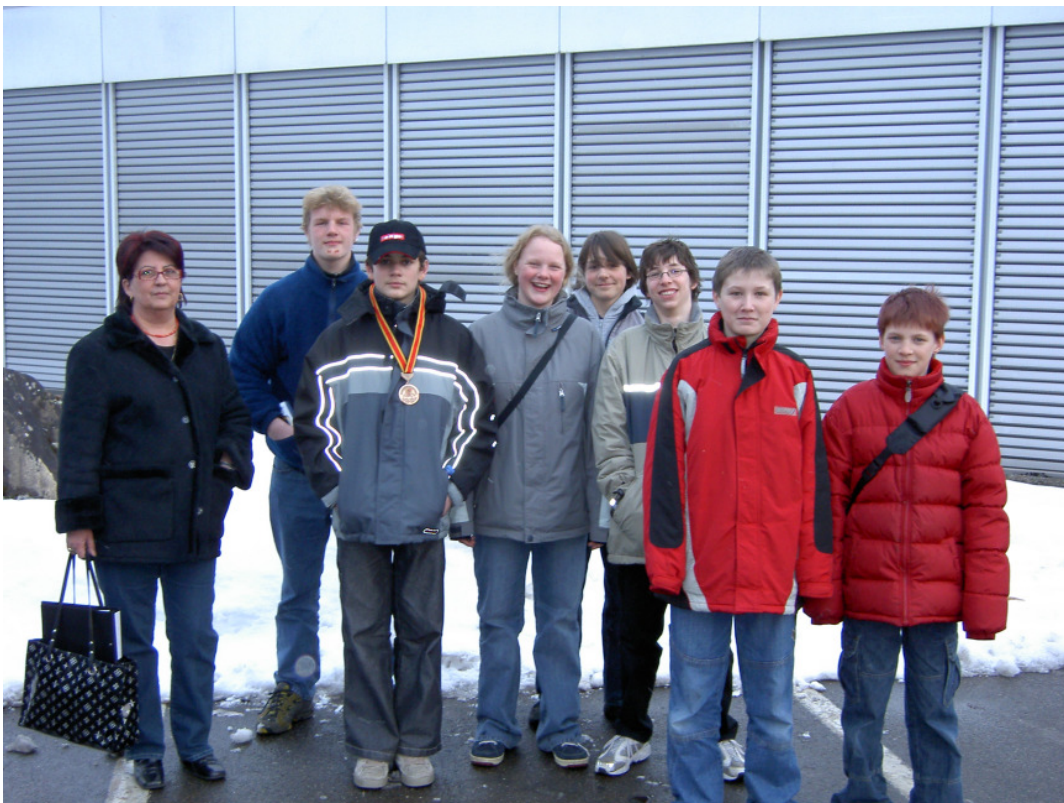
Die Langenthaler Mannschaft (nicht vollzählig) am 26.02.2005 in Burgdorf