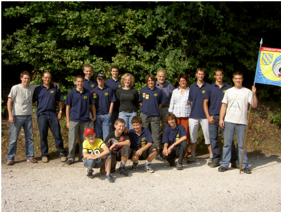
Die Delegation der SGL mit den 300 m Jungschützen, den Pist-Junioren und deren Betreuern