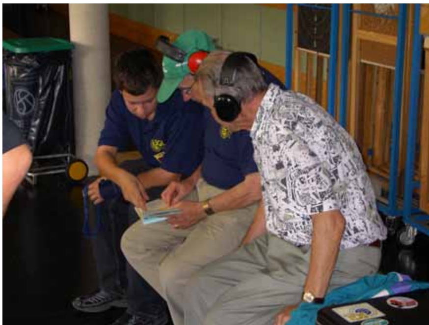
Ein Bild welches Freude macht „Alt & Jung“ ziehen am gleichen Strick.

Wir konnten wiederum ein tolles Jahr mit tollen Leistungen unserer Junioren erleben. Disziplin und Wille sind bei diesen jungen Leuten absolut vorhanden und es macht sehr viel Freude mit einer solch guten Gruppe zu arbeiten.