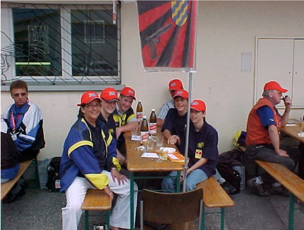
Haben gut lachen: Nach geschlagener „Schlacht“ nicht mit Bier sondern mit Rivella

Am Schluss sei noch allen gedankt, den Junioren für Ihre Disziplin, den Betreuern für den Einsatz und nicht zuletzt den Eltern unserer Junioren, welche die jungen Leute ermutigen mitzutun und die Verantwortlichen bei der SGL unterstützen.