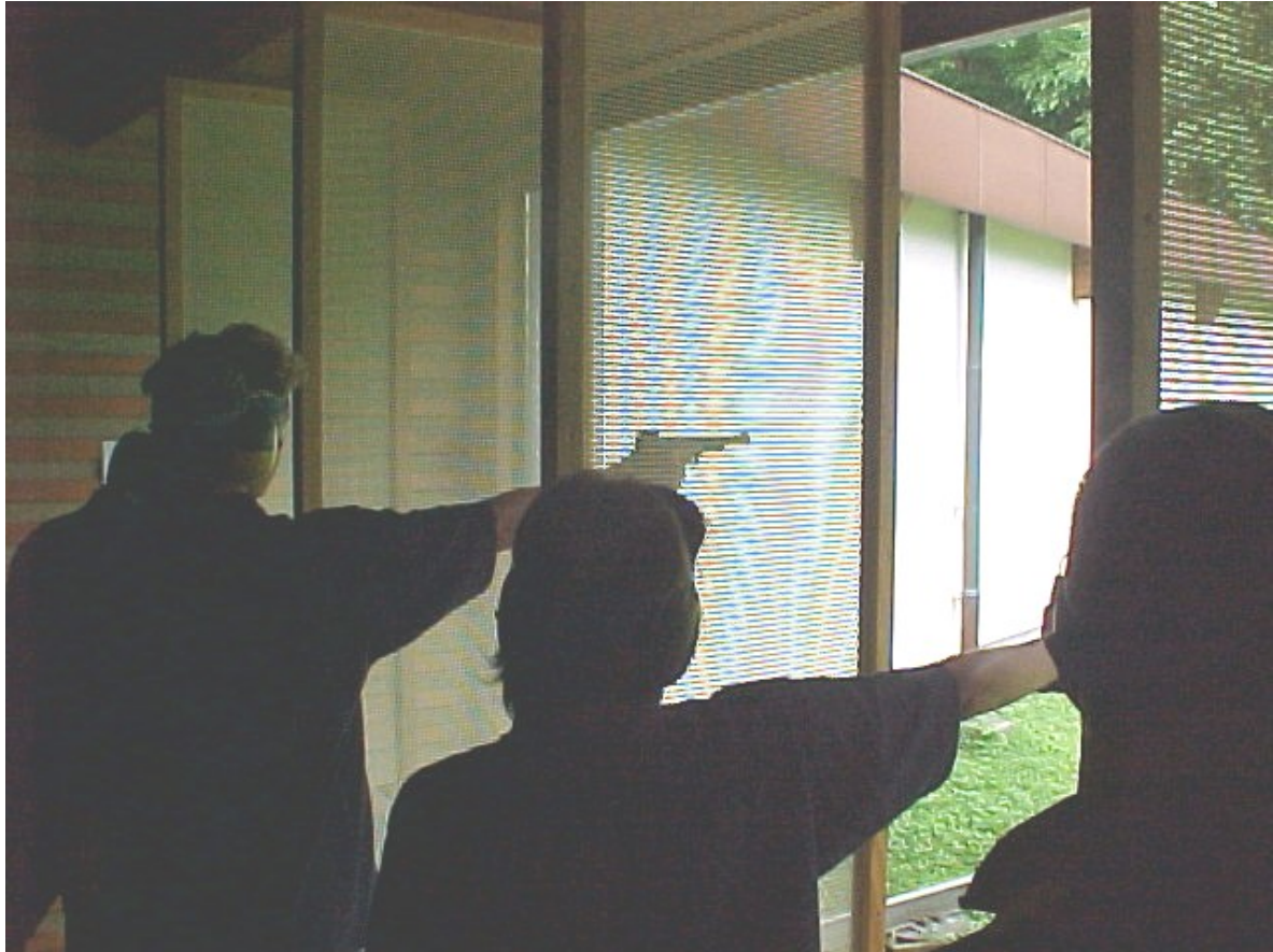
Unsere Junioren im Feuer bei der Präzision

Das ESFJ bietet die Gelegenheit einen Leistungsvergleich zwischen den Jugendlichen in der gesamten Schweiz zu machen. Im Vergleich kann die SGL mit den Junioren zufrieden sein. Sämtliche Junioren konnten sich im ersten Drittel der Rangliste einreihen, was doch ein gutes Zeichen ist, wenn man bedenkt wie kurz die Vorbereitung auf diesen Anlass war.