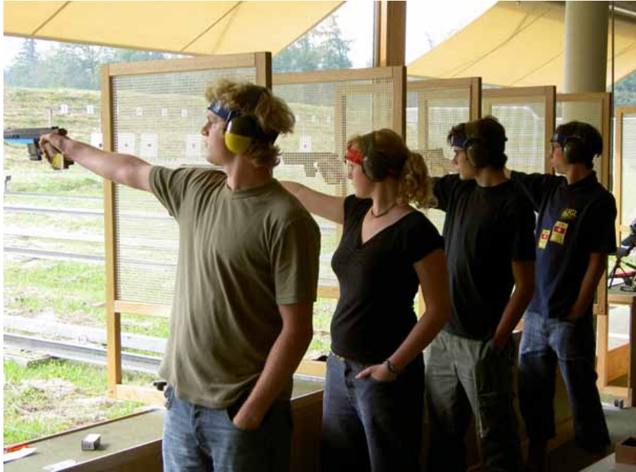
Ein Teil der Junioren im Einsatz für die SGL