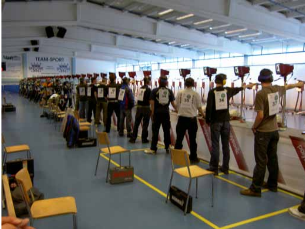
Die Kulisse mit 40 Scheiben machte allen einen grossen Eindruck