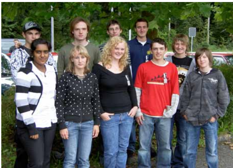
Unsere Zukunft, junge Menschen!

Im Bereich Pistole hat es sich gezeigt, dass die Abgänge minimal sind, bis Heute haben wir nur eine Juniorin verloren und dies weil die Eltern aus der Region weggezogen sind. Die Juniorin blieb aber dem Schiesssport treu und geht dem Pistolenschiessen bei der PS Fahrwangen nach.