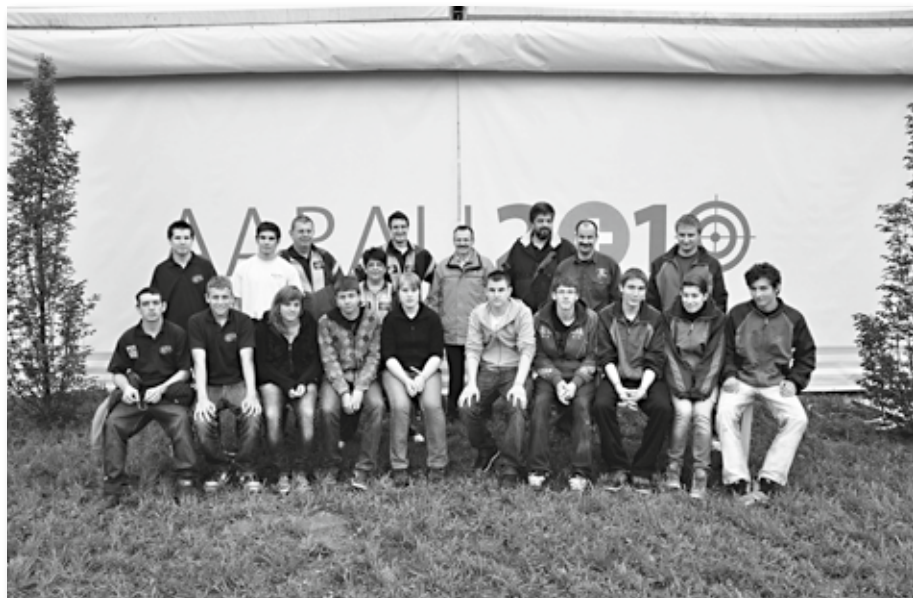
Die Vertreter des Kantons Bern